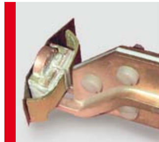
Inductor coil for pneumatically assisted compression brazing Induktor zur pneumatisch unterstützten Pressverlötung