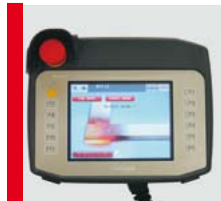
Operating unit Bedienteil