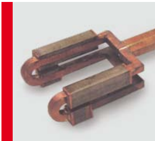
Contour-adapted brazing inductor Konturangepasster Lötinduktor